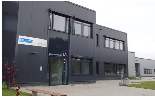
Gebäude der SLV Fellbach mit Geschäftsstelle Fördergemeinschaft